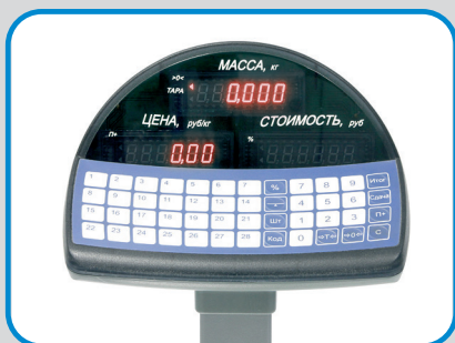
Дисплей и клавиатура