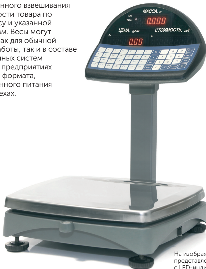
На изображении представлена модель ШТРИХ М5Т с LED-индикацией

Торговые весы ШТРИХ М5Т предназначены для взвешивания, фасовки, порционного взвешивания и расчёта стоимости товара по измеренному весу и указанной цене за килограмм. Весы могут использоваться как для обычной стационарной работы, так и в составе автоматизированных систем учёта товаров на предприятиях торговли любого формата, точках общественного питания и фасовочных цехах.